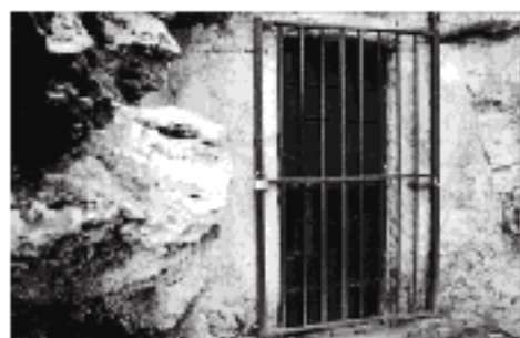
Entrada a la cueva, en Gombizosa de Mar/Cantabria.

accesibles al público, pero manteniendo los límites de conservación exigidos para estas pinturas de más de 14.000 años de antigüedad.