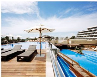
Momento de relax en la piscina.

Pero volvamos al arte porque es lo que diferencia al complejo de cualquier cinco estrellas afincado con gracia en la isla. Y hay muchos... Para empezar, éste entra de lleno en el concepto de art