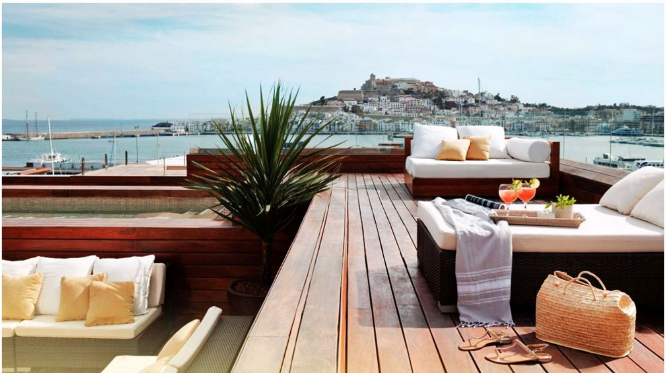
La terraza del Ibiza Gran Hotel , con sus apetecibles vistas al casco antiguo de la ciudad.

Portada España África América Asia Europa Oceanía Bitácoras Hoteles Noticias