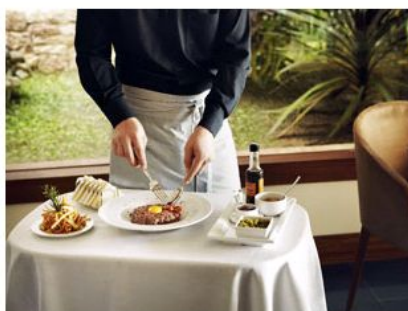
Hay que probar el tartar, el tataki...

En el club Gaia, en cambio, un mural de 26 fotos narra el día a día de la isla desde los 60. Ideal para escudriñar mientras el sushiman prepara un ceviche o una tabla de sashimi ante tus ojos. El capítulo gastro