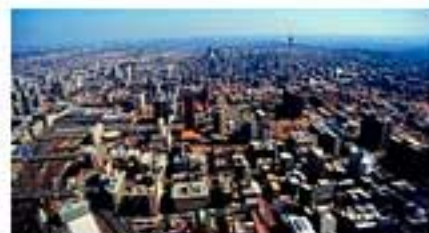
Trois villes françaises dans le