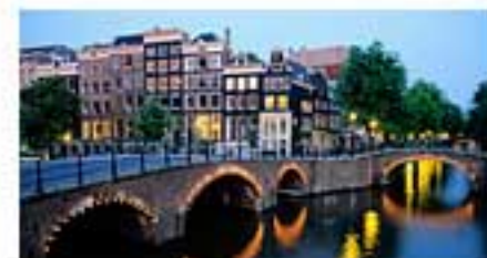
Top 5 des destinations les